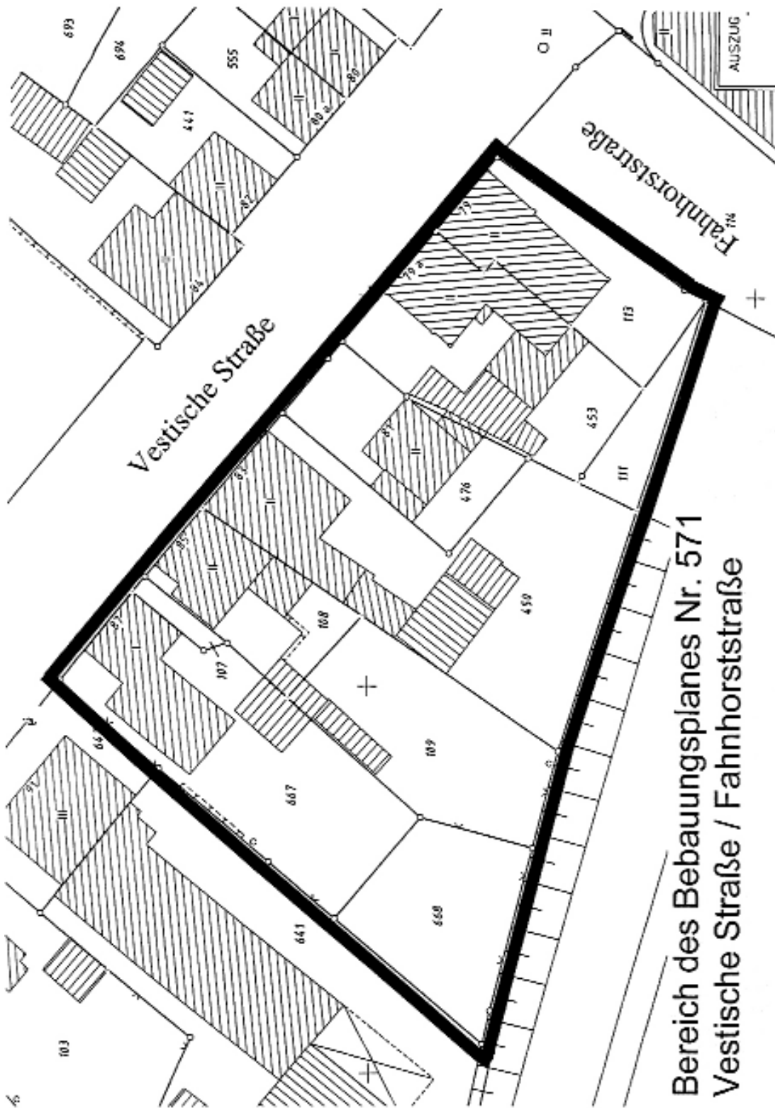
Bereich des Bebauungsplanes Nr. 571 Vestische Straße / Fahnhorststraße