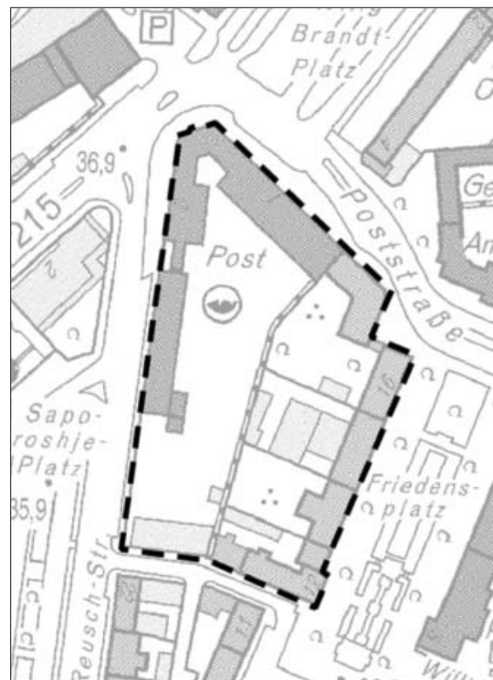
Verfahrensgebiet Bebauungsplan Nr. 651 - Poststr. / Paul-Reusch-Str. -